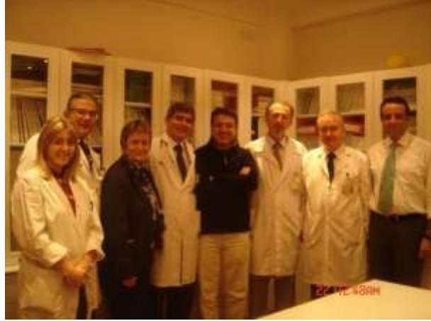
Resim 5: İstanbul Tıp Fakültesi Gastroenterohepatoloji Bilim Dalı Akademik Kadrosu