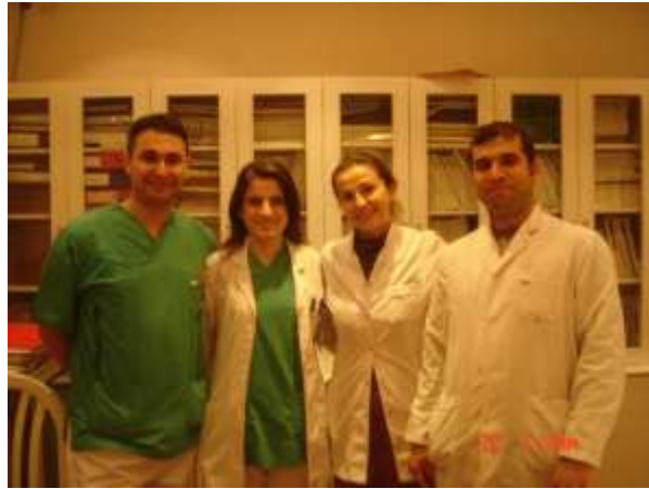
Resim 6 : Halen İstanbul Tıp Fakültesi Gastroenterohepatoloji Bilim Dalı 'nda yan dal asistanlığı yapan dahiliye uzmanları