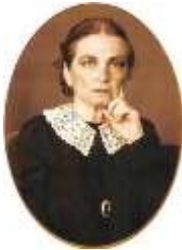
Dr. Elizabeth BLACKWELL

Kadınların dünyada ve ülkemizde erkeklerle eşit haklardan yararlanmak için giriştikleri zorlu uğraşlar sonucu elde ettikleri haklardan biri Tıp mesleklerine girme hakkıdır ki, ilk kez ABD'de Elizabeth Blackwell, uzun direnişler sonucu Tıbbiye'ye girdi ve 1849'da diplomasını aldı (1,2). İlk "resmi" kadın hekimdir, ancak çalışma izni alamaz.