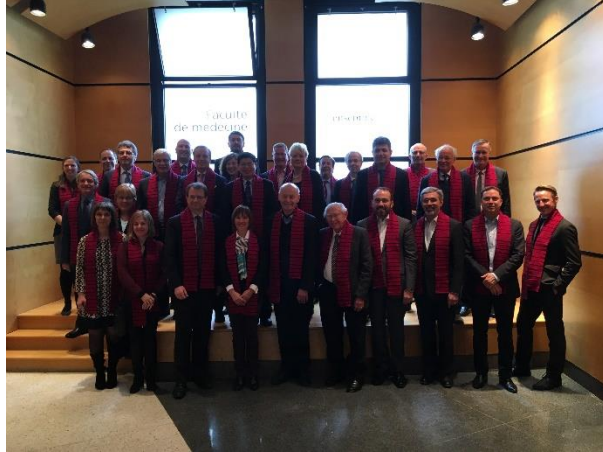
M8 Alliance Üyelerinin Oluşturduğu Aile Fotoğrafı