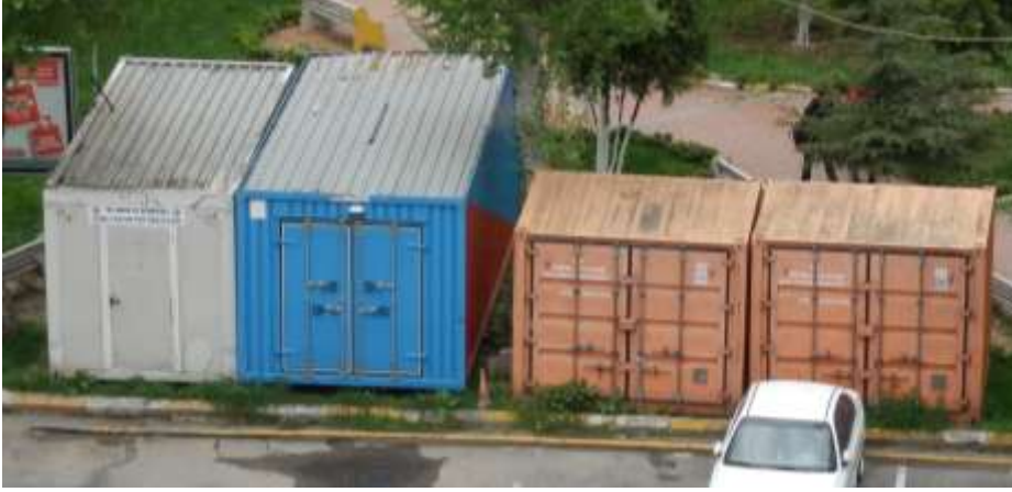
Resim 1: UMKE ve Sivil Savunma Konteynırları