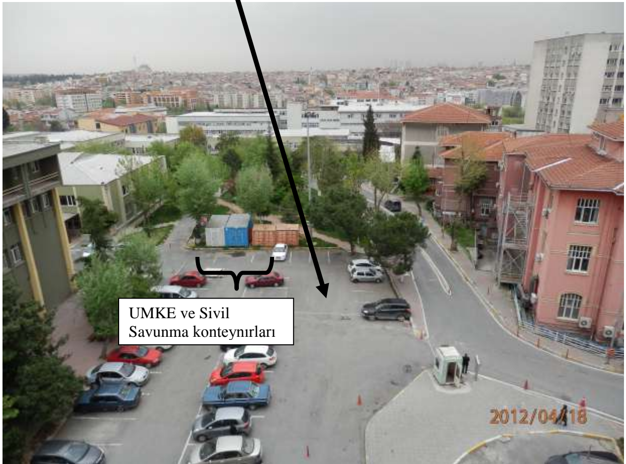
Resim2: Acil Komuta merkezi ve toplanma alanı.